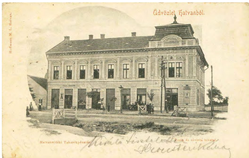
A posta és távírdai hivatal épülete egy 1899-ben megjelent levelezőlapon