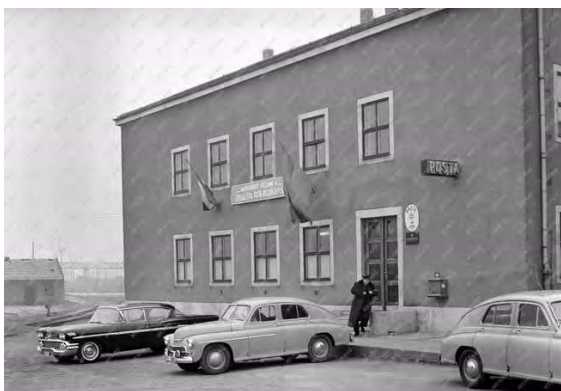
1Az új postahivatal épülete a hatvani vasútállomáson. A táblán a felirat: "Határozott célunk a szocialista posta megalapítása."