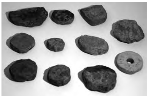
Csiszolt játék korongok

A Hatvan környéki kora bronzkori falvak tárgyai között többször előfordulnak törött edénydarabokból kör és szögletes alakúra csiszolt korongok. Az így kialakított kis tárgyak láttán csakis valamilyen tábla játékra gondolhatunk. Talán a malmozás, a malom játék valamilyen elődjét játszhatták. Azért azt nem mondhatjuk, hogy csak gyakorolták a csiszolást, hiszen a malom tábla legkorábbi ábrázolása a Földközi tenger keleti területeiről már ismert volt ebből az időből, és a késői bronzkorszakból is.