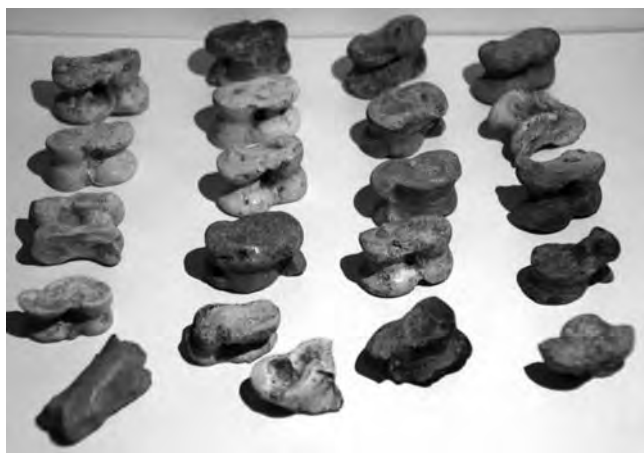
Egyik oldalán, vagy élén csiszolt csigacsontok a hatvani kultúra falvaiból

A görögöknél, rómaiaknál kedvelt szerencsejáték volt már a kocka, vagy a kockaként használt asztragalosz juh- vagy kecskelábcsontról, de az ősi jóspraktika emléke sem homályosodott el teljesen. Tiberius császár arany „kockával” kérdezi meg a jövőt egy vállalkozása előtt, s amikor Julius Caesar élete legnagyobb és legkockázatosabb lépésénél azt a megjegyzést tette, hogy a kocka el van vetve – alea iacta est! – szó szerint értette, amit mondott. A dobókocka (nevezzük most így a dobótesteket az egyszerűség kedvéért), az egyik legősibb játékeszköz lehetett, melyet az emberiség ismert, és máig széles körben elterjedt. Eredete csaknem az emberiséggel egyidős, de a kialakulásának pontos körülményeit sajnos nem ismerjük. A legkorábbi feljegyzések melyek dobókockára utalnak, bizonyos csontokról szólnak. Ezeket az eszközöket állati boka- és ujjperc-csontokból készítették, és jóslásra használták. Mágikus erőt tulajdonítottak nekik, és hitték, hogy a csontok megmutatják a jövőt, vagy segítenek bizonyos döntések meghozatalában.