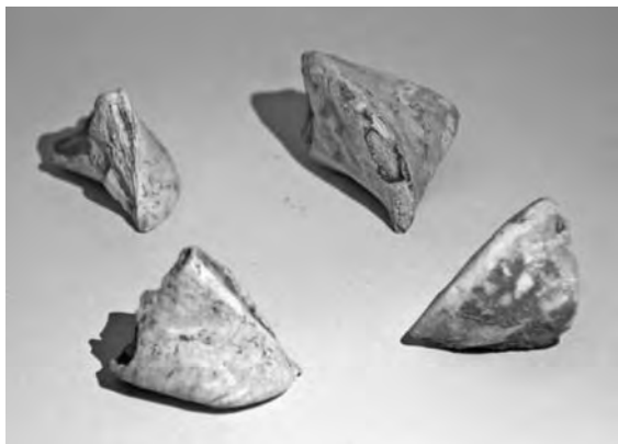
A négy darab osztriga búb

A fent említett tárgyak is azt bizonyítják számomra, hogy a hatvani kultúra korai és középső bronzkori műveltsége, mely 200–300 éven keresztül élt környékünkön, nem akármilyen népcsoport volt. Igaz nem építettek piramisokat, nem éltek több ezres kővárosokban. Falvaik szigorú rend szerint működtek erődjeiken belül és kívül. Falusi életet éltek, télen és nyáron. Napi tevékenységük közepette ott voltak körülöttük a gyermekeik. A lányok segítettek főzni, ételt készíteni, valósan és játék konyháikban. Utánozták a felnőtte-