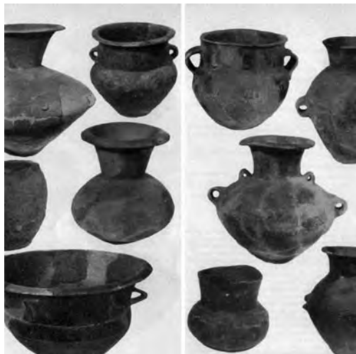
Az Ifjúság úti építkezések során feltárt sírokból előkerült edények

A hatvani kultúra feltárt temetői, sírjai alapján elmondhatjuk, hogy halottaikat elégették, a hamvakat vagy a sírgödör aljára szórták, vagy a sír egyik edényébe, általában a legnagyobb méretű urnába temették el. A hamvak között sokszor ott vannak a halotti máglyából származó faszendarabkák is. Valószínű, a tökéletlen égés miatt a csontokat pedig összetörték. Mellékletként pedig több, gyakran 8–10 edényt (tálakat, bögréket, fazekakat) is helyeztek a sírba. Az edényekbe valószínűleg ételmet tettek a túlvilági szükségletekre. A sírokban talált edények általában vékony falúak, törékenyek. Valószínű nem a háztartásban használatos edények sírba tételéről van szó, hanem a temetésre, a halottnak külön készítették a kollekción. Sokszor kerülnek elő a sírokból nagyobb kövek, kődarabok. A sírok és a temetők is sokszor nagy távolságra vannak egymástól, egy temetőben csak kevés, átlagosan 8–10 sír van. Elképzelhető, hogy a nagycsaládok, a rokonságok külön-külön temetőt használtak. Sokszor a temetőket a lakóhelytől patak, völgy, mocsár különíti el. Eddig kevés hitelesen feltárt temetőt ismerünk.