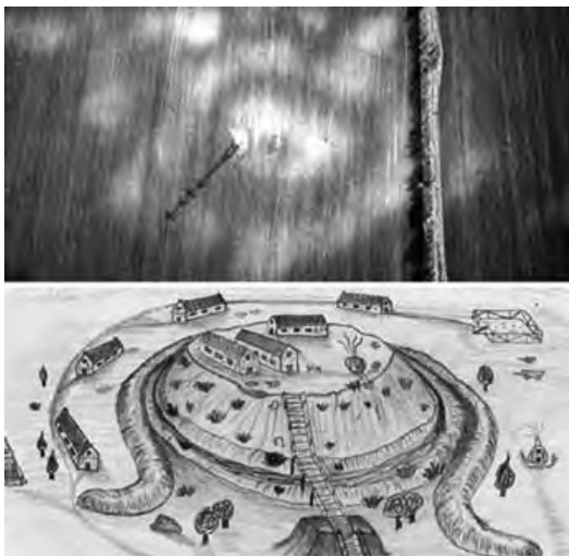
A közelben lévő Heréd-kerekhalom nevű hatvani kultúrárs falu légi felvétele, és az árokkal, sáncsal védett lakhely rekonstrukciós kísérlete látható

Az 1970-es években Hatvanban igen sok lakóház épült. Az építkezések során számtalan tárgy, és edény pusztult el, de sokat juttattak el belőlük az építkezők a hatvani és az egri múzeumokba. A legtöbb lelet a hatvani kultúra temetőiből, sírjaiból került elő. 1970. decemberében homokbányát létesítettek a hatvani Delelő utcában. A Zagyva mocsaraiból enyhén kiemelkedő homokdombban két bronzkori sírt találtak. (Azóta lakóházak vannak a helyén). Valószínűleg több sírt is elpusztíthatott munkája során a markológép, vagy a későbbi építkezéseknél dobták ki a cseréptöredékeket. Az Ifjúság úti lakótelep alapozási munkálatai során is sok sír került elő. A Balassi Bálint utcában is több hamvasztásos sírt találtak a munkások. (A Hatvani Lajos Múzeumban számos tárgyi emlékük látható.) Kultúrájukban keleti és északi elemek ötvöződnek a helyi hagyományokkal. Kárpát-medencei letelepedésük során pedig olyan déli, égei tengeri, macedóniai hatások érték őket, amely életmódjukat is jelentősen megváltoztatta, de mezopotámiai elemeket is hordoznak. Lakóhelyük kialakításában a jól védhetőség dominált, természetes és mesterséges védőművekkel megerősítve. Jellemzőjük a sáncárokkal erősített telep, várrész-szel és településrész-szel akár hegyvidéki, akár síkvidéki faluval találkozunk.