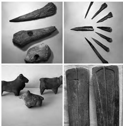
Agancs és csonteszközök, állatszobrocskák, és tör öntőforma a tárgyi emlékek közül

A leégett házak vermeiből gabona magvak kerültek elő. Ismerték és termesztették a búza, az árpa több fajtáját, a rozst, a kölest. Fejlett állattartásukra a falvak hulladék gödreiből előkerülő nagymennyiségű csont utal. A csontok vizsgálata kimutatta, hogy legnagyobb számban juhot, kecskét és szarvasmarhát tartottak, kisebb mértékben sertést és lovat. Az állatokat a fajta lehetőségeinek megfelelően húsáért, bőréért, gyapjáért tenyésztették. Még a csontjaikat is felhasználták, ebből készítették a változatos és praktikus csontszerszámokat: árákat, kalapácsokat, kaparókat a bőrok feldolgozásához, simítókat az edények készítéséhez, és még sok mindent a mindennapi élet szükségletei szerint.