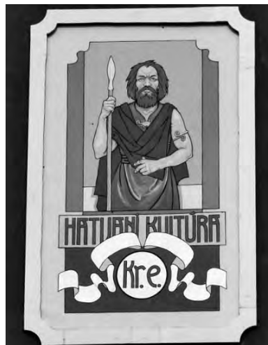
A bronzkori embert ábrázoló falkép a hivatal homlokzatán

Városunk dicsőséges múltjából örökített meg pillanatképeket a művész a hatvani polgármesteri hivatal homlokzatán. A képek közül az első egy őskori, bronzkori, lándzsás embert ábrázol. Nem őseemberként, inkább a mai emberre hasonlít a fizimiskája. Ő is itt élt a mai városunk területén. A környékbeli legelőkön tartotta állatait, a Zagyva vizéből itatta őket, a körülöttünk lévő lankás domboldalakat törte fel, és ültette el magvait. Ezen a területen temette el halottaikat, kik ma is nagy számban a lábaink alatt pihennek. Házait, faluját a Strázsahegyen építette fel, melyet erős, mesterséges védelemmel látott el. Fegyvereit, használati tárgyait a földbe süllyedve találták meg egykoron, és bukkannak rá még ma is. Vajon hogyan éltek, hogyan teltek a mindennapjai úgy 3700 évvel ezelőtt? Vajon miért nevezték el településünkről ennek a több ezer évvel ezelőtt élt embernek a népét? A válaszokat az időben jóval korábbról kapjuk.