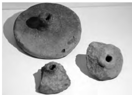
Agyagból készült kocsikerekék, illetve egy kocsi modellje

kei. A kultikus tárgy felé billenti a mérleget maga a tény, hogy „sírban” volt, és hogy a kevés számú példányok mindegyike rendkívül gondosan kivitelezett, gazdagon díszített, ami csak ritkán mondható el az agyag játékedényekről. Mindenesetre arányában sok agyag kerék került elő, kisebb nagyobb méretben a Hatvan környéki falvakból.