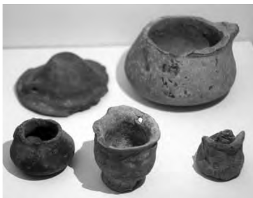
Kis méretű edénykék a Hatvan környéki bronzkori falvakból

Sok olyan tárgy is van a leletek között, amiket csak gyermekjátékként tudunk értelmezni. Ezek általában a felnőttek eszközkészletének kicsinyített másai voltak, amik beleférnek egy apró gyermekkézbe is. A telepeken gyakran találunk olyan kis edénykéket, melyeknek nem lehetett más céljuk, mint a lurkók szórakoztatása. Ma sincs ez másként, a konyhában sürgölődő anyuka mellett a gyerek babakonyhában készíti a „vacsorát”, az őskori gyerekek is ilyen játékedényekkel tanulhatták a főzés tudományát. Néha nehéz eldönteni, hogy ezeket a tárgyakat felnőtt csinálta-e néhány hirtelen mozdulattal (nesze, kölk, főzz te is!), vagy éppen egy gyermek gyakorolta így a fazekasság fogásait. A Strázsahegyi bronzkori településről és a környező falvakból több „mikro” edényke is előkerült, főleg felszíni gyűjtésből. Sajnos, a fából,