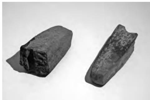
Agyag „kőbalta” töredékek